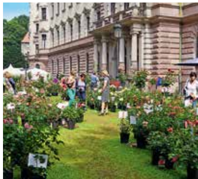
FOTO (RECHTS): Mariae Gloria Fürstin von Thurn und Taxis lädt Sie herzlich zur Gartenschau in den Park des Schlosses St. Emmeram nach Regensburg ein.